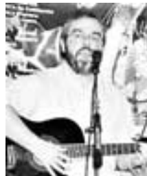
Montero acaba de publicar dos cedés con todas sus canciones